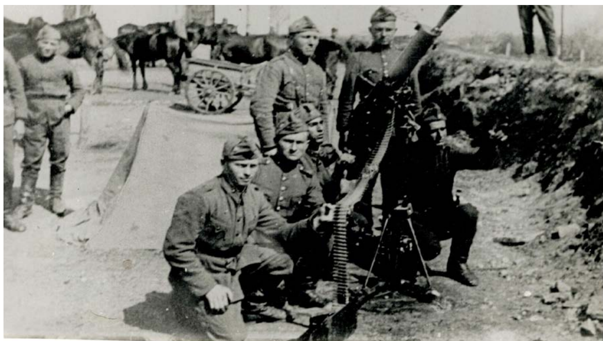
Фиг. 2. Снимка на група войници от гр. Фердинанд (днешна Монтана) с тежка картечница „Шварцлозе“, пригодена за противовъздушен бой.