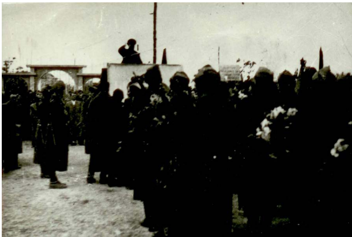
Фиг. 1. Снимка на Девета дивизионна тежко-картечна дружина строена за митинг. Заснета през зимата на далечната 1944 г. в близост до портите на Градската градина в Михайловград. Инв. 97, НСФ, ННИ, РИММ.